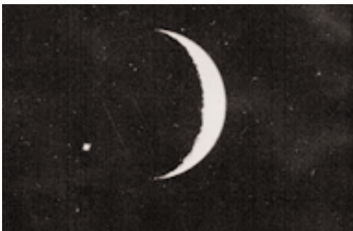
Sur cette photo, on aperçoit encore Vénus. Elle est ensuite cachée par la Lune.

La première difficulté consiste à trouver la Lune dans le ciel diurne. Rappelons que sa visibilité dépend beaucoup de la transparence du ciel. Il vous faut chercher à environ 50° d'élévation en direction du l'est-sud-est. Si vous ne la voyez pas à l'œil nu, il est raisonnable de ne pas chercher à s'acharner et de renoncer à cette observation ... en effet l'idée de balayer la zone avec un instrument semble risquée dans le cas d'une pratique en groupe : un jeune pourrait pointer accidentellement le Soleil. Or, le risque n'est pas seulement l'éblouissement mais aussi une lésion de la rétine.